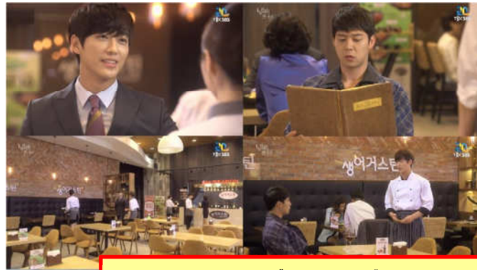
オ・チョリム(シン・セギョン)のアルバイト先のレストラン