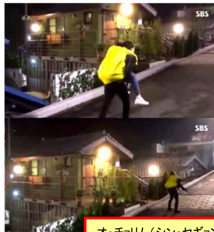
オ・チョリム(シン・セギョン)の家