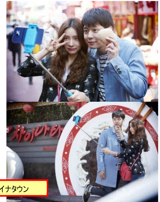
仁川チャイナタウン