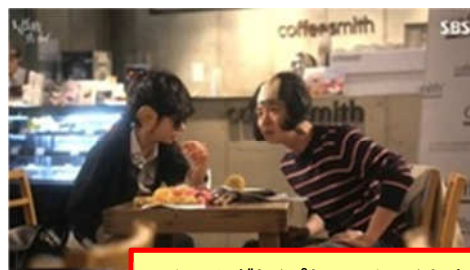
チェ・ムガク(パク・ユチョン)とオ・チョリム(シン・セギョン)と一緒に漫談の練習をしたカフェ