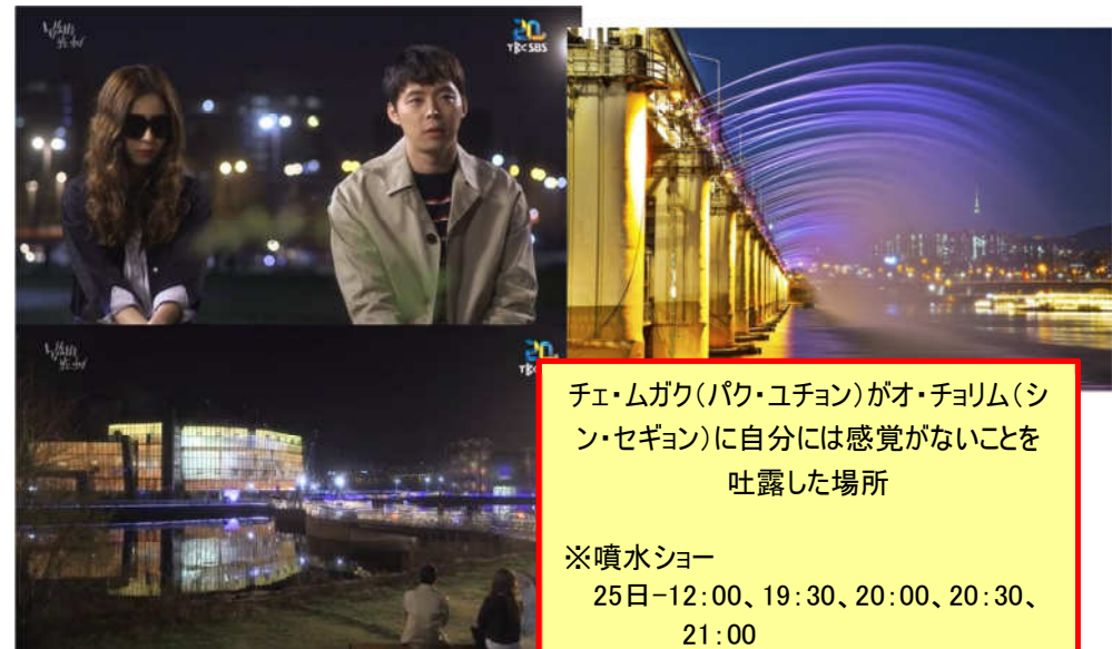
チェ・ムガク(パク・ユチョン)がオ・チョリム(シン・セギョン)に自分には感覚がないことを吐露した場所